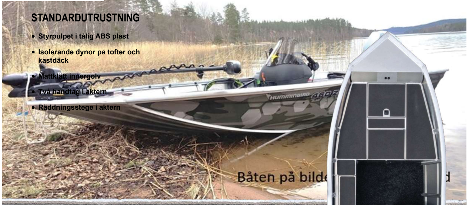
Båten på bilden