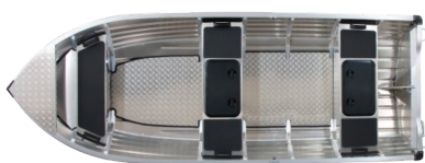
Tillval Fördäck för elmotor